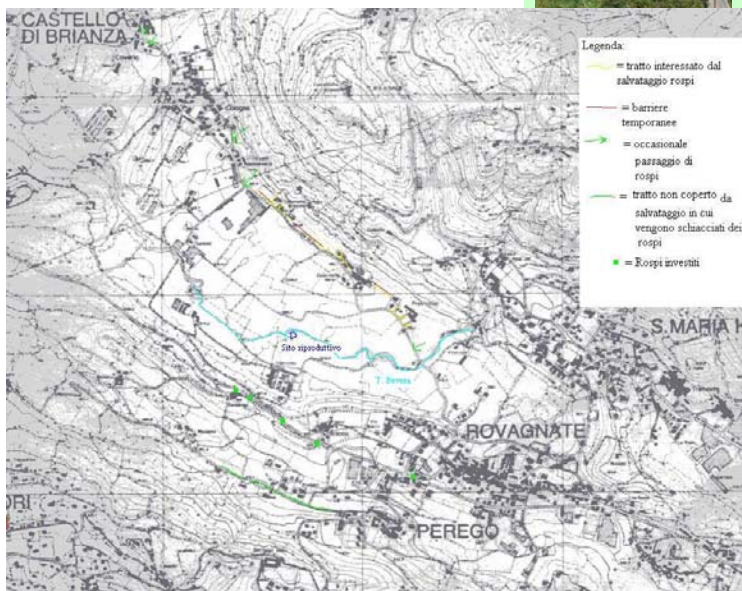
Cartina che illustra i tratti di strada interessati da passaggio di rospi durante il periodo di riproduzione