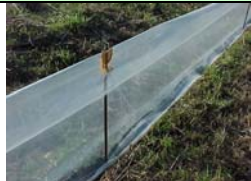
Un tratto del telo di polietilene steso per circa 800 metri in località Cassina Fra Martino di Sartirana; i picchetti sono ricavati da tondino di ferro.