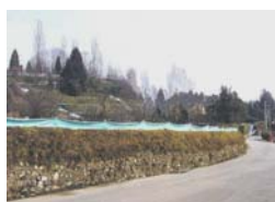
Alla base del muro di pietre che delimita il tratto verso monte della strada di Cassina Fra Martino verranno realizzati due nuovi sottopassi per favorire la migrazione degli Anfibi.