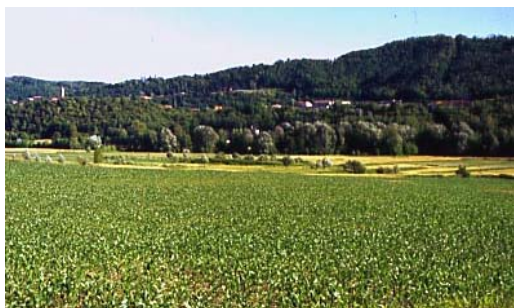
L'area di riproduzione degli Anfibi che attraversano la strada provinciale 52 tra le località di Cascinette bianche e Prestabbio