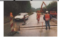
Parco Colli Euganei - 1999

1990 Strada prov.le Canzo-Asso - Como / Comune di Canzo condotte sottostradali Provincia di Como Parco Loc. Lago del Segrino - Gruppo Naturalistico della Brianza