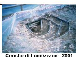
Conche di Lumezzane - 2001

tunnels a sezione circolare da 50 cm, elementi in cemento, molto interrato con invoglio a largo raggio sui due lati