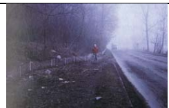
Lago del Segrino - 1990

Data di realizzazione o progetto - Località e descrizione Ente che ha sostenuto o effettuato l'intervento Persona, Associazione o Ente proponente 1980 Lago d'Idro - Brescia / Comune di IDRO 5 tunnel tra Vantone e Vesta Comune di Idro - WWF Sezione Brescia