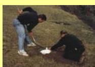
Il tombotto del Settore 1 di ZU opportunamente attrezzato per una discesa autonoma dei rospi.