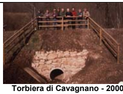
Torbiera di Cavagnano - 2000

progetto di tunnels in elementi di cemento