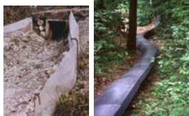
Lago d'Idro - 1980

L'elenco che segue, dei tunnel per Anfibi italiani, potrebbe non essere completo nè aggiornato, in quanto molte iniziative già realizzate non sono state adeguatamente pubblicizzate. Ci scusiamo con i promotori di questi interventi e chiediamo loro di inviarcì al più presto una adeguata documentazione per aggiornare le nostre conoscenze.